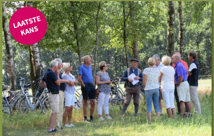
Battlefieldtour Keukenklep Lunteren

De deelnamekosten bedragen 7,50 pp (pinnen is mogelijk). Daarbij inbegrepen is een eenvoudige lunch te velde en een boekwerkje over de wapendropping.