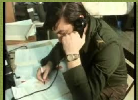
Het bericht moet door

Aanstaande dinsdagavond 21/8 vertonen we opnieuw een film, ditmaal met de titel: ' Het bericht moet door ', uit 1965. De film is gemaakt door de Leger Film en Fotodienst en speelt zich af in de omgeving van Ede. In het eerste gedeelte wordt na 20 jaar teruggekeken op de verbindingen tijdens de Slag om Arnhem. Ze worden vergeleken met de 'moderne' radiomiddelen uit de jaren zestig. Het tweede deel laat interessante beelden zien over de naoorlogse Verbindingsdienst . We zien beelden van de opleidingen in Ede en een parate verbindingsoefening rond de brug om Arnhem.