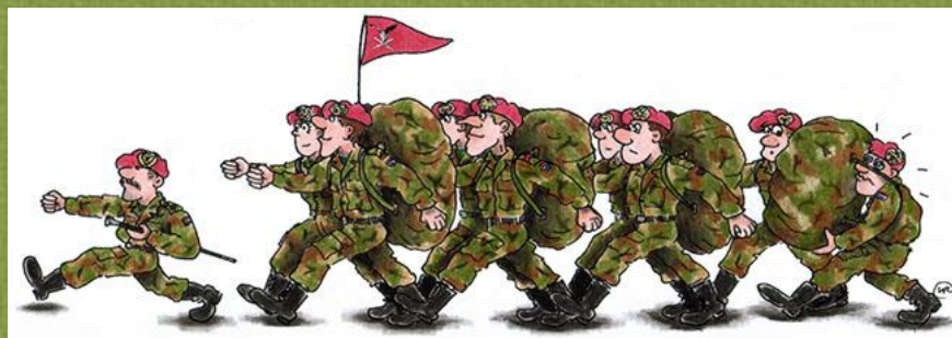
Living history: op naar De Smederij!

In de Smederij zelf is een mess (kantine) ingericht uit de tijd van de dienstplichtigen, waar u een traditioneel soldatenontbijt als een kop koffie met gevulde koek kunt kopen.