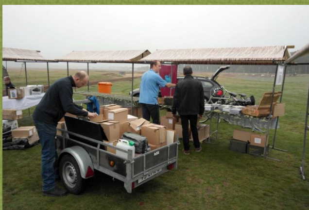
Opbouw Airbornemarkt 2015

Dinsdagavond 29 augustus gaan we ons voorbereiden op de komende Airbornemarkt, die voor zaterdag 16 september op het programma staat.