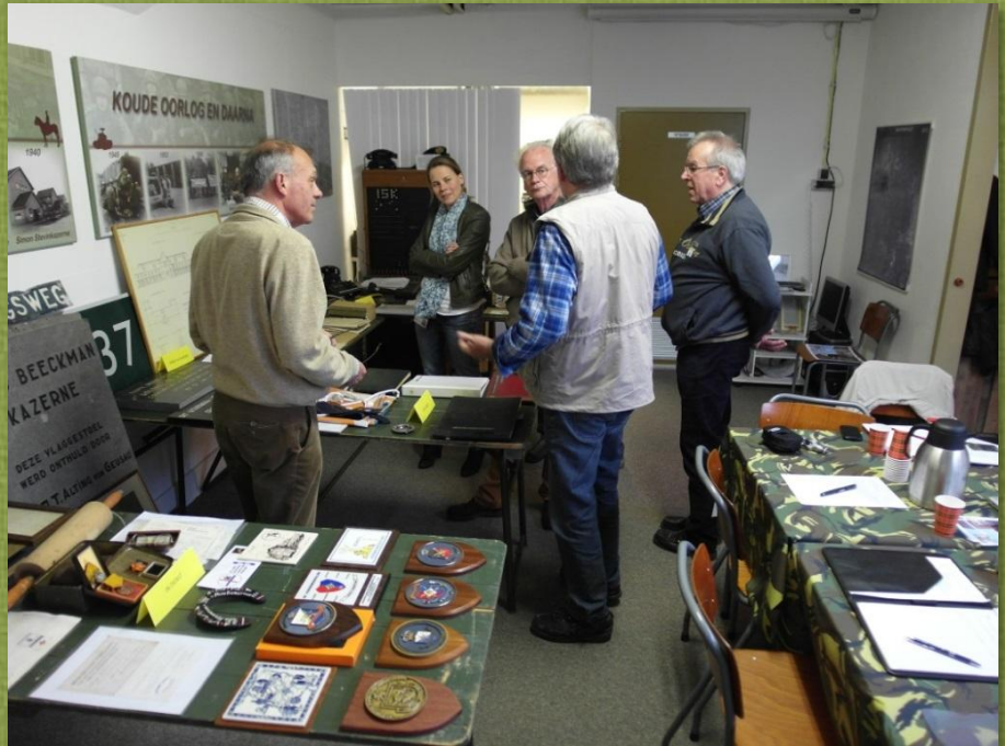
Foto: De gemeente Ede en deelnemende Erfgoedinstellingen zijn in het MHIP bijeengekomen voor de selectie van 100 voorwerpen voor de expositie 'In dienst in Ede'.

Met de catalogus in de hand zullen de voorwerpen met bijbehorende verhalen voor de bezoeker duidelijk worden.