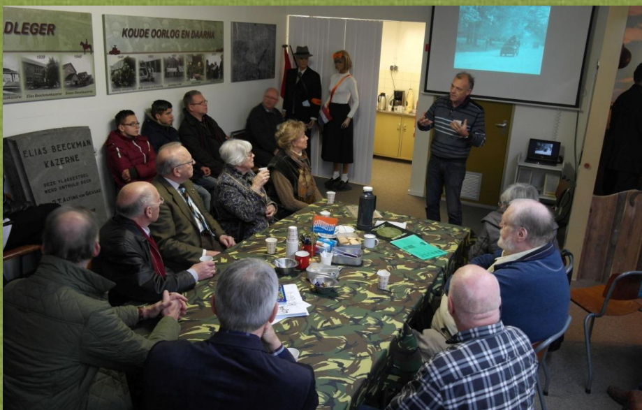
Het was gezellig druk in het MHIP tijdens de opening van de nieuwe tentoonstelling.

De tentoonstelling in het MHIP kan nog worden bezocht op de zaterdagen 28 maart, 11 april, 2 mei, 11 juli, 25 juli, 8 augustus en 25 augustus. Het MHIP is op deze dagen van 10.00 tot 16.00 uur gratis toegankelijk.