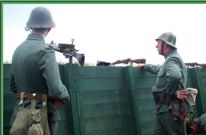
Loopgraaf uit mei 1940 komt weer tot leven

In aansluiting op de Grebbeliniedagen verzorgt de Vereniging Vrienden van het Airborne Museum op zaterdag 19 mei een excursie langs de Grebbelinie. De excursie start bij station Ede-Wageningen. Per bus zal langs de linie worden gereisd tussen Ede en Achterveld. Bij Achterveld wordt een bijzonder gaaf bewaard gebleven deel van de linie bezocht, waar onlangs meerdere kazematten en loopgraven zijn gerestaureerd.