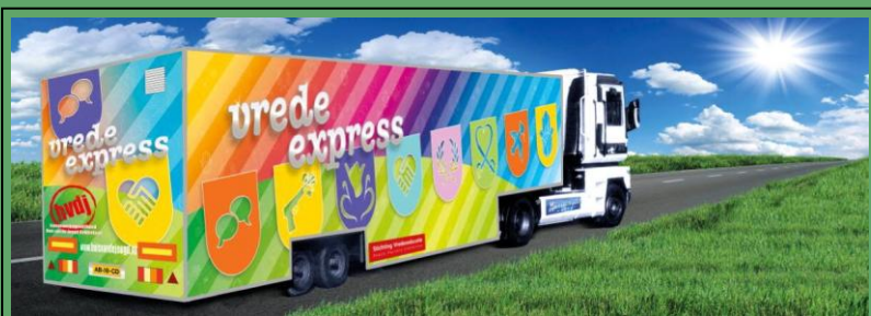
De Vrede Express

Boekenbeurs WO-2 Zaterdag 9 juni - 10.00 ÷ 16.00 uur Airborne Museum Oosterbeek