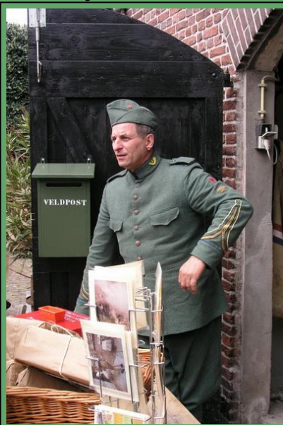
Militair uit de meidagen van 1940

In Veenendaal kan een onlangs gerestaureerde Nederlandse kazemat die midden in een woonwijk ligt worden bezichtigd. Het Fort aan de Buurtsteeg, tussen Veenendaal en De Klomp, zal in haar oorspronkelijke staat worden teruggebracht. De werkzaamheden zijn hier in volle gang. Op 19 mei is het mogelijk onder leiding van een gids het bouwterrein te bezoeken. Bij het fort zal het mobiele informatiecentrum Grebbelinie staan, waar u onder meer filmpjes, foto's, kaarten en plattegronden kunt bekijken.