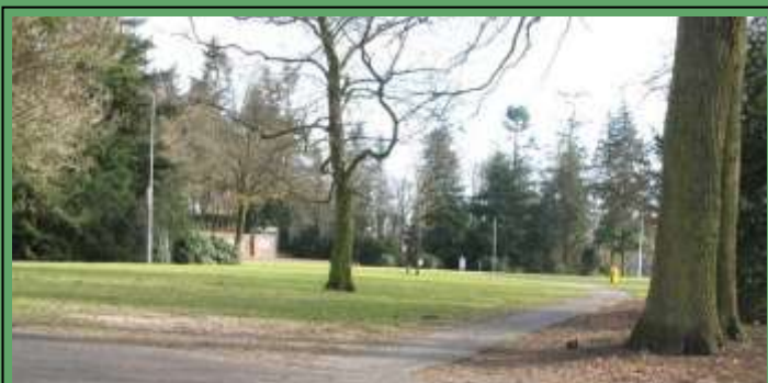
Geplande locatie Joods monument

Op woensdagmiddag 18 april om 14.00 uur zal voor deze slachtoffers een monument worden onthuld. Het monument komt te staan in het park bij de splitsing Vossenakker - Bergstraat - Paasbergerweg, langs de route van de jaarlijkse