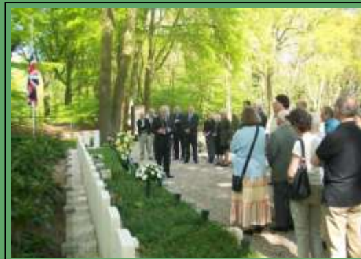
Algemene Begraafplaats Ede

Helaas krijgt deze herdenking vaak niet de aandacht die het verdient. Uw aanwezigheid bij deze ceremonie wordt vanuit het platform dan ook zeker aangemoedigd.