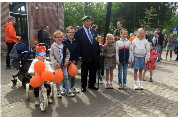
Met een veteraan op de foto

Aansluitend trakteerde het VOC de aanwezigen op een stukje oranjekoek en een glaasje oranjebitter. Deze geste werd, zoals ieder jaar, zeer gewaardeerd door de aanwezigen.